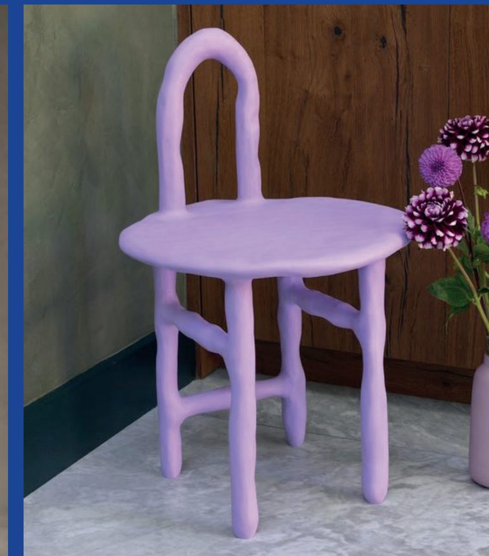
MARTEEN BAAS 355€