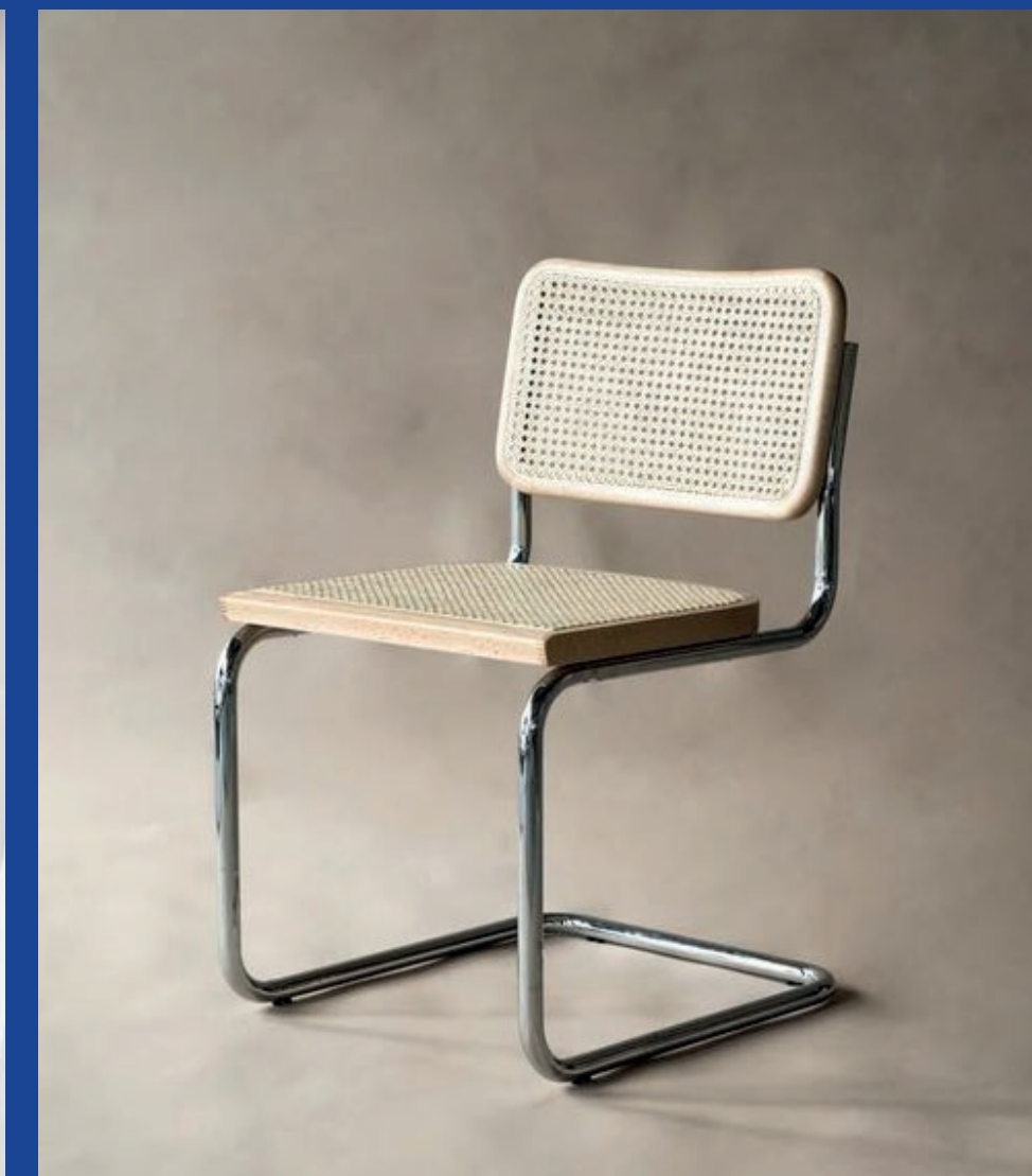
MARTEEN BAAS 355€