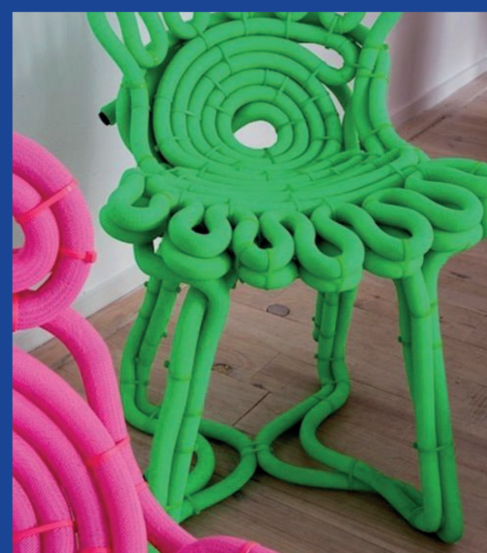
MARTEEN BAAS 355€