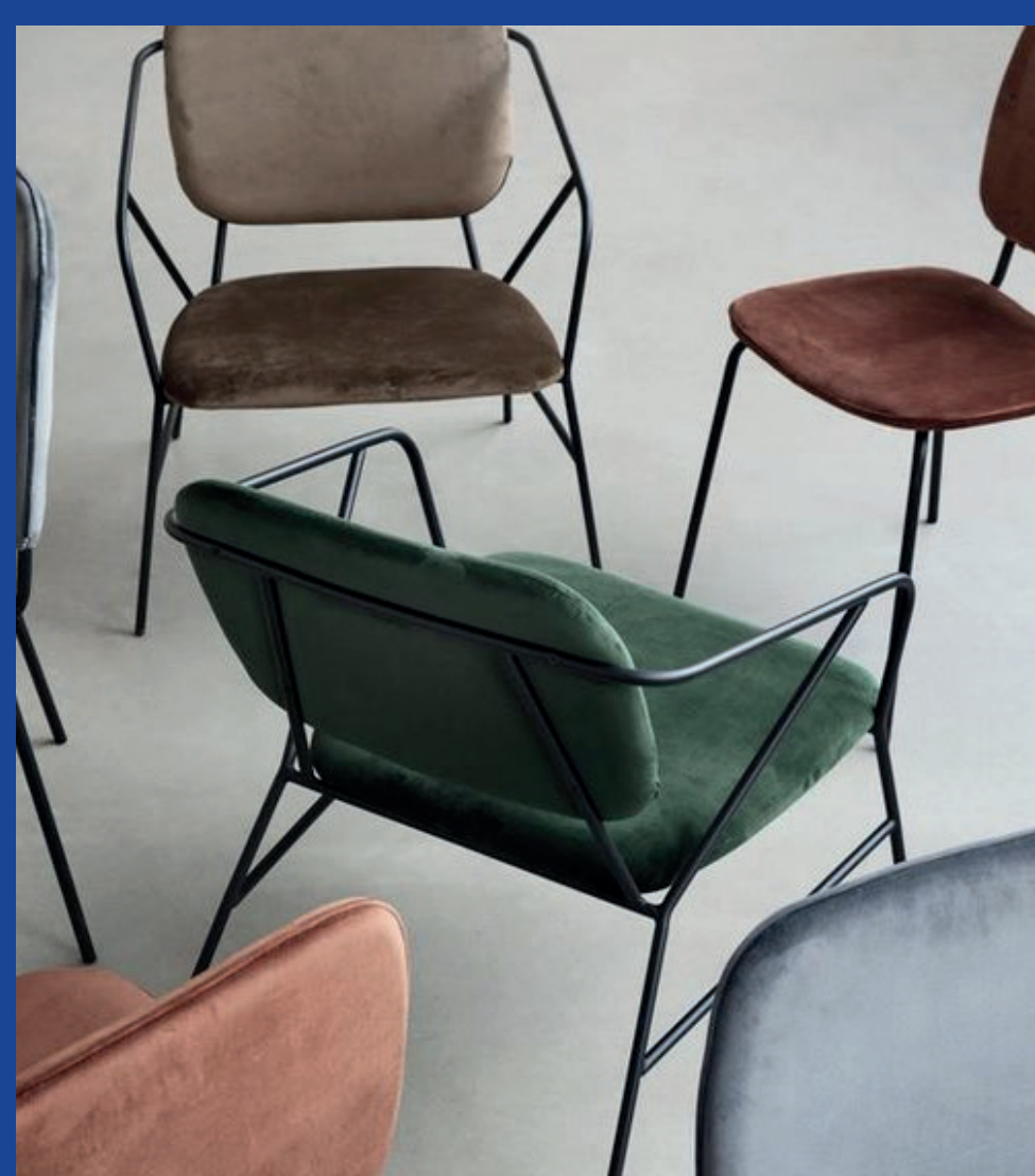
MARTEEN BAAS 355€