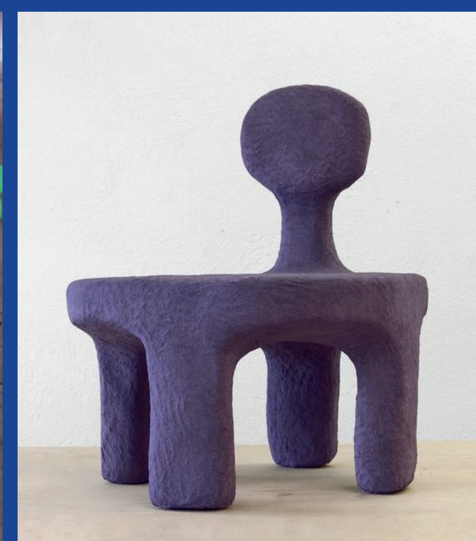
MARTEEN BAAS 355€