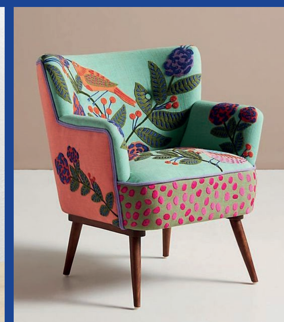
MARTEEN BAAS 355€