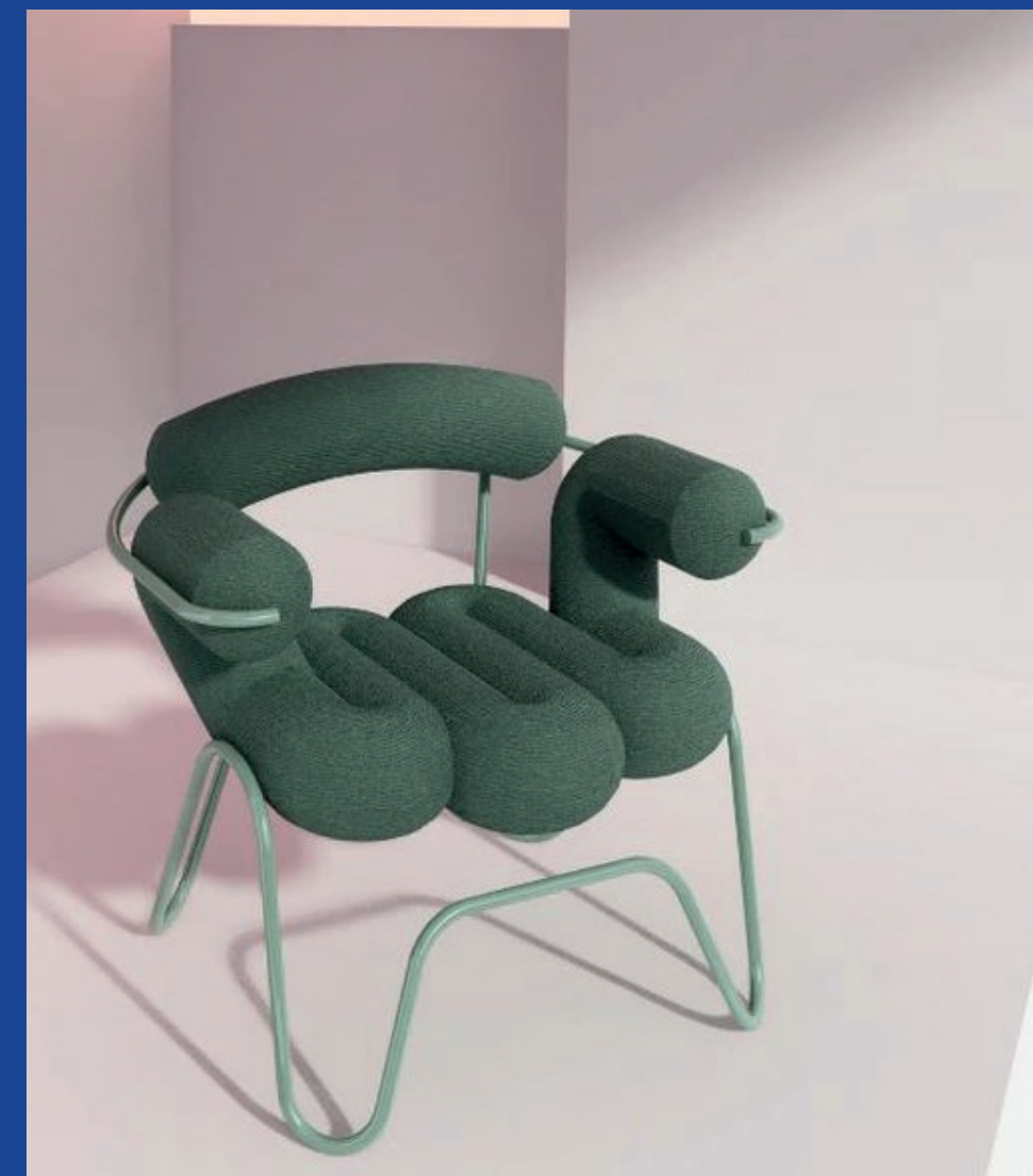
MARTEEN BAAS 355€