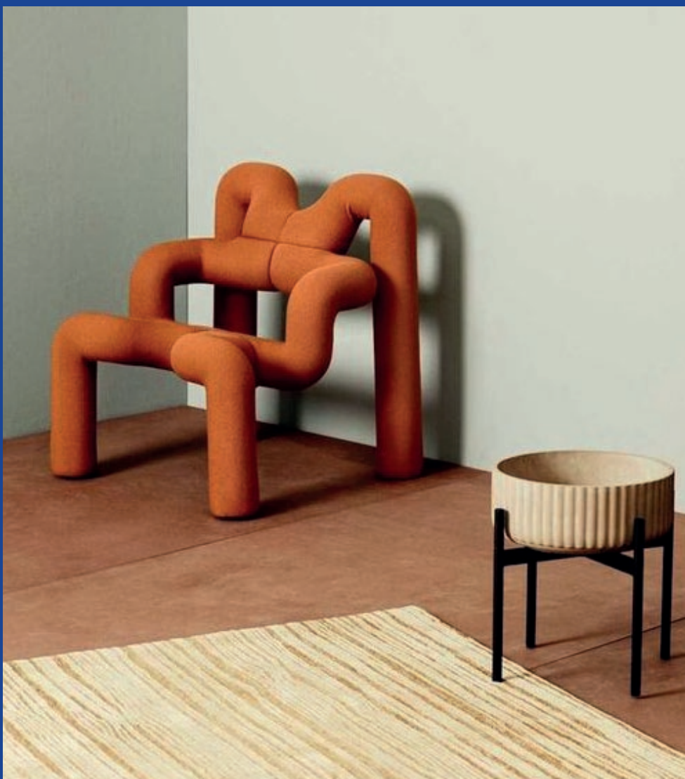
MARTEEN BAAS 355€