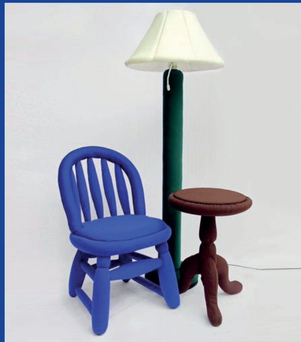
MARTEEN BAAS 355€