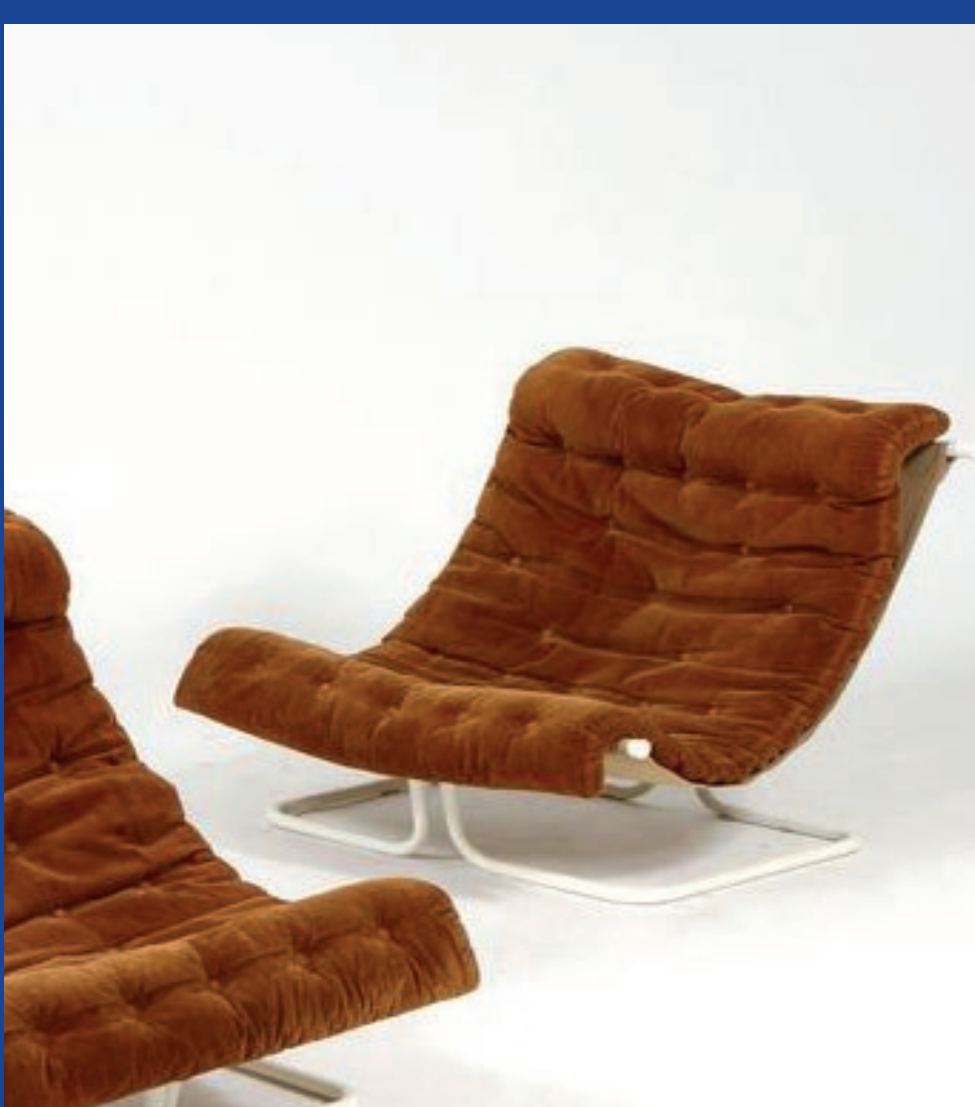
MARTEEN BAAS 355€