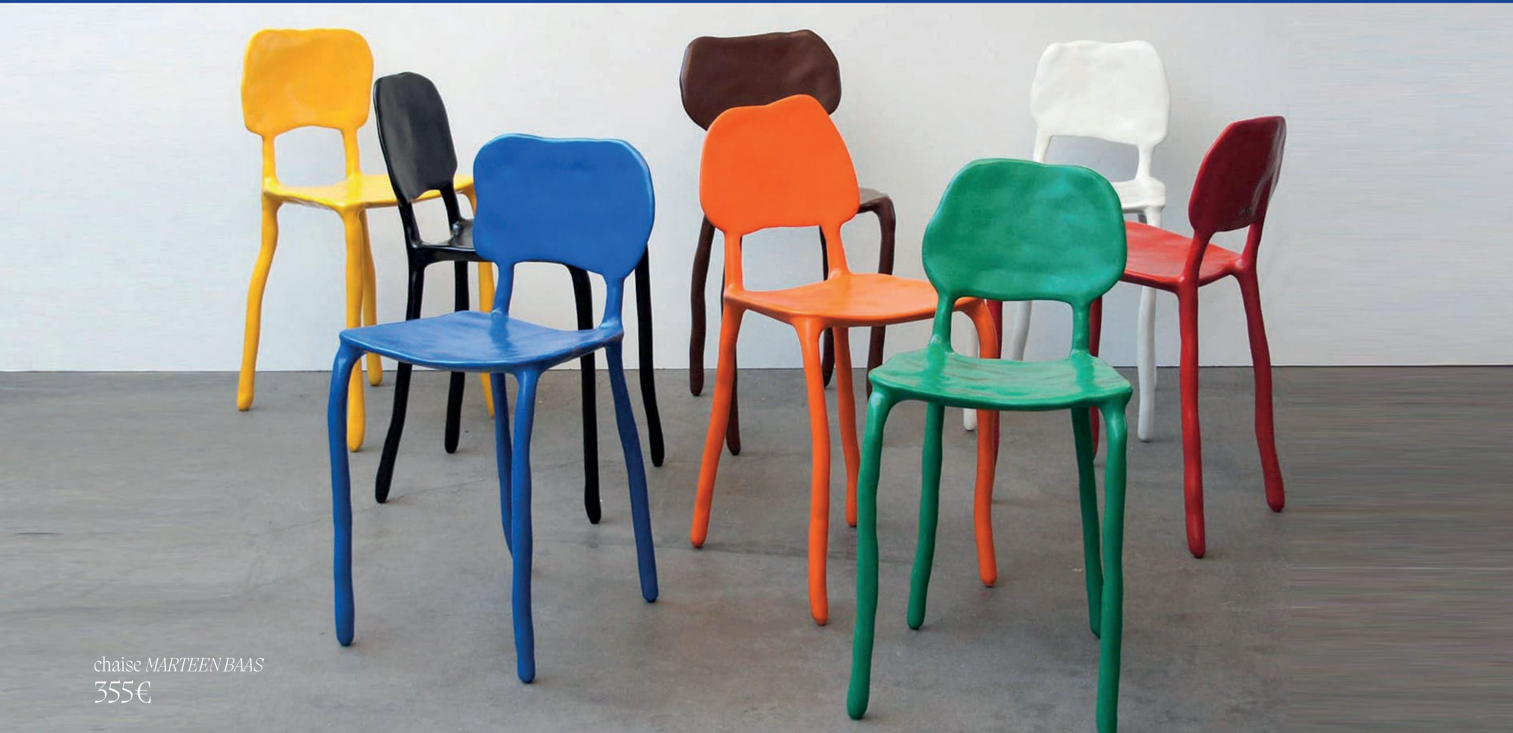
chaise MARTEEN BAAS 355€